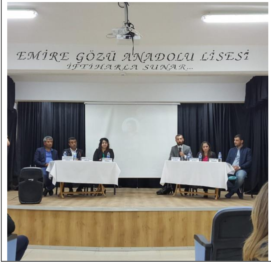
Tecrübe Dinamizm ile Buluşuyor Projesi